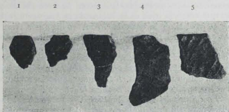
Fig. 193. — Fragments de ceràmica de les coves del Castillo a Puente Viesgo (Santander) (núms. 1, 3 i 5) i de Canto Pino (Iruiz) (1/5 apr.)

Aquesta decoració de la ceràmica de la cova del Boquique no sembla ésser quelcom únic al